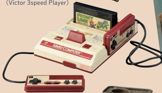
ファミリーコンピューター