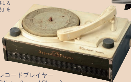
レコードプレイヤー (Victor 3speed Player)