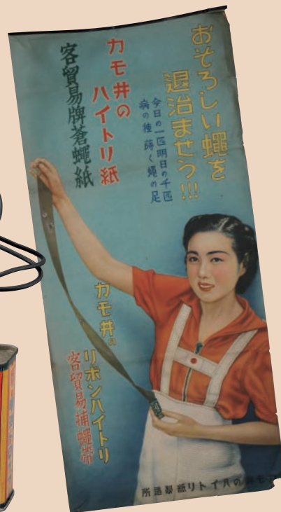
カモ井のハイトリ紙ポスター