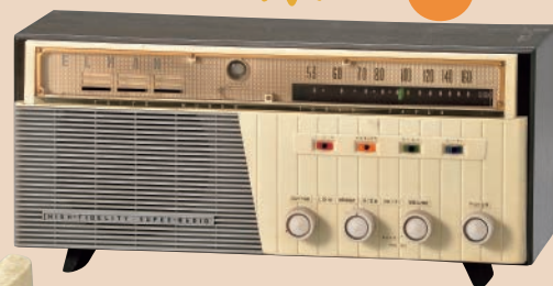
真空管ラジオ (大洋無線電機 ELMAN)

独特な色合い、王道の花柄、言葉のチョイス。昭和らしいデザインセンスがうかがえる、おしゃれなモノたちを集めました。当館自慢の映画コレクションも一挙公開。